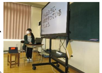
高等部保健指導の様子

給食ができるまでの流れについて知りました。また、給食がおいしく栄養があっても安全であるヒミツがわかりました。一人一人、給食でがんばることも考えました。