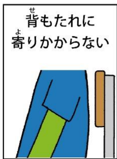
背もたれに寄りかからない