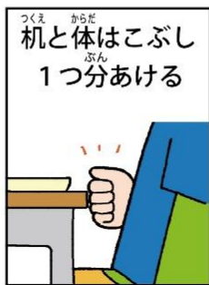
机と体はこぶし1つ分あける