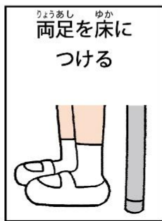
両足を床につける